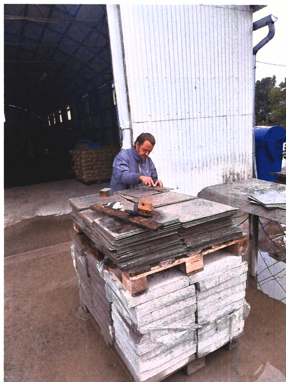
Kép: járdalapok osztályozása, raklapra pakolása, sablonok takarítása a Szarvasi u. 64/1. szám alatti telephelyen