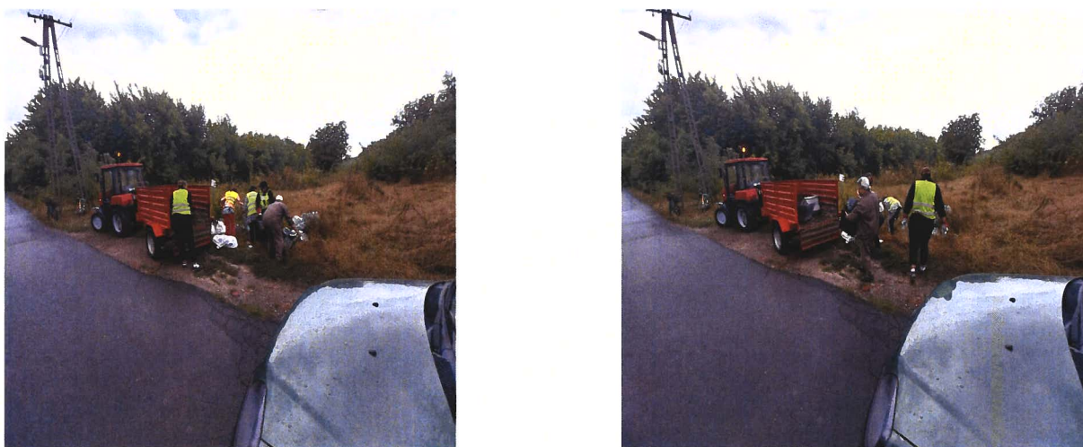
Kép: illegális (elhagyott) hulladék gyűjtése a Kisvasút utcában

Az illegális hulladéklerakóhelyek felszámolása sajnos nem tud több évre kiható értéket biztosítani, mert az illegális hulladék mennyisége folyamatosan újratermelődik