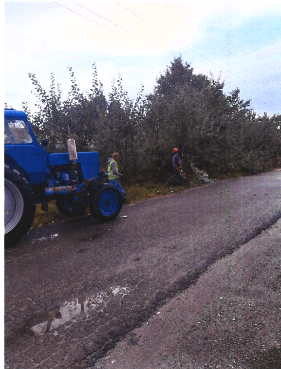
Kép: A Szánthó Albert utcában található mederburkolt árok takarítása, illetve fák nyakazása, gallyazása a Táborhely utcában